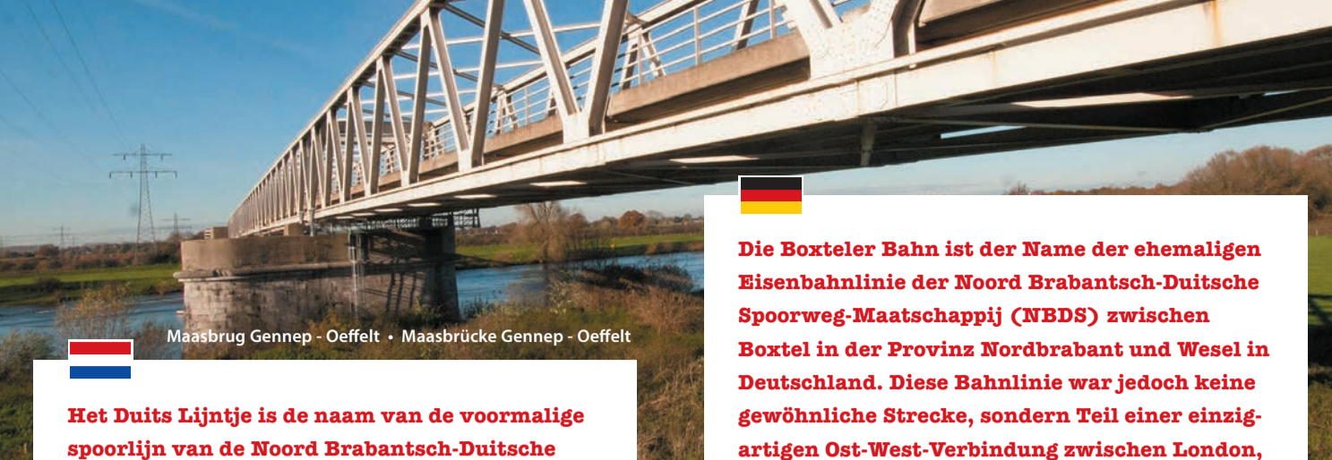
Maasbrug Gennep - Oeffelt • Maasbrücke Gennep - Oeffelt

Het Duits Lijntje is de naam van de voormalige spoorlijn van de Noord Brabantsch-Duitse Spoorweg-Maatschappij (NBDS) die liep van Boxtel in Brabant tot Wesel in Duitsland. Deze spoorlijn was echter niet zomaar een spoorlijn, maar maakte deel uit van een unieke oost-westverbinding tussen Londen, Berlijn en Sint Petersburg. Tussen 1873 en 2004 werden zowel passagiers als goederen over deze lijn vervoerd, inclusief leden van koningshuizen en tsaren-families die elkaar bezochten.