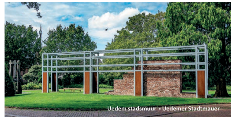
Uedem stadsmuur • Uedemer Stadtmauer

In dem Martinusturm kann man eine interaktive Ausstellung besichtigen, die der Boxteler Bahn gewidmet ist. In einer Vitrine fährt eine Miniatureisenbahn, die die (verschwundenen) Gebäude von Gennepe beleuchtet.