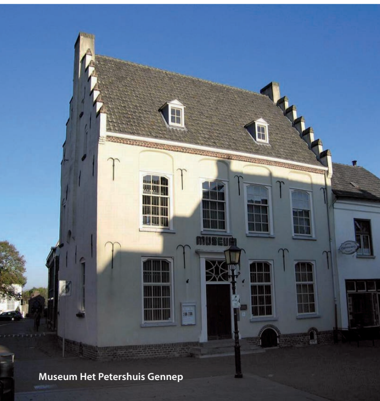
Museum Het Petershuis Gennepe