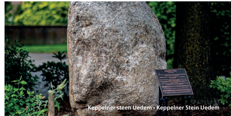
Keppelner steen Uedem • Keppelner Stein Uedem

Hält man den Zug an, so wird ein kurzer Film projiziert, der über das jeweilige Gebäude informiert.