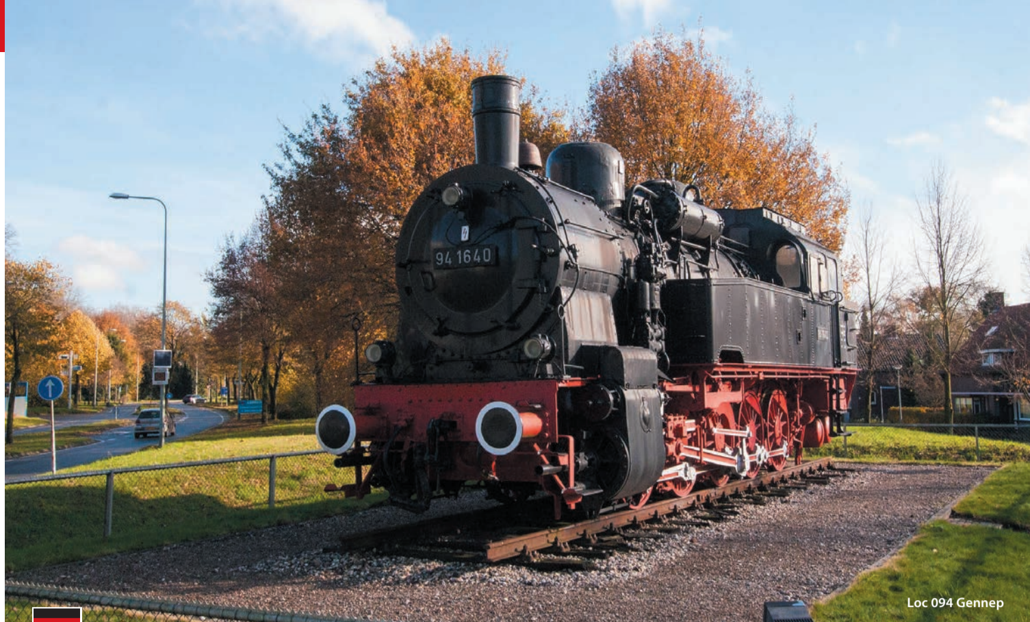
Loc 094 Gennepe