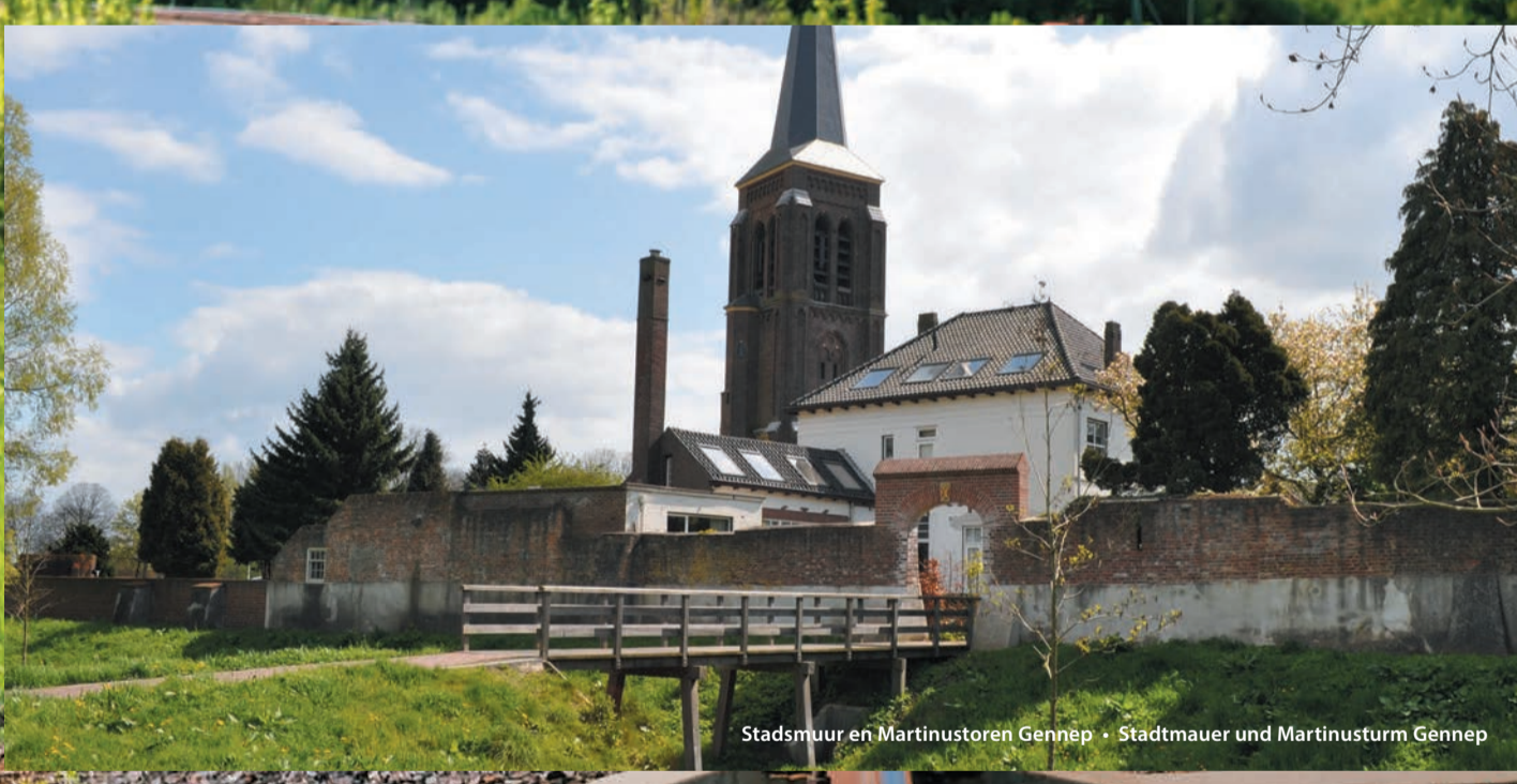
Stadsmuur en Martinustoren Gennep • Stadtmauer und Martinusturm Gennep

In samenwerking met de gemeenten Land van Cuijk, Uedem en Weeze zijn zes grensoverschrijdende fietsroutes ontwikkeld. In samenwerking met de gemeenten Land van Cuijk, Gennep, Goch, Kalkar, Bergen, Gennep, Goch, Kalkar, Land van Cuijk, Uedem en Weeze worden zes grenzüberschrijdende Fahrradrouten ontwikkeld. www.visitnoordlimburg.nl/fietsenovergrenzen