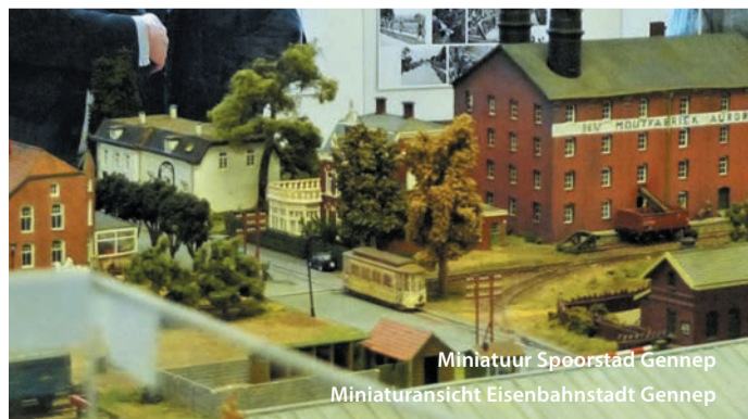
Miniatuur Spoorstad Gennepe Miniatuuransicht Eisenbahnstadt Gennepe